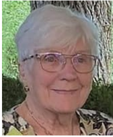
13 84485 foto