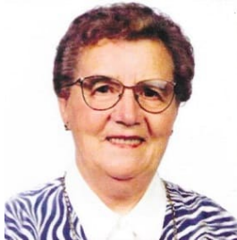
9 84613 foto