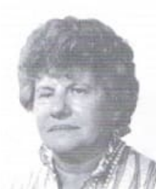
1 524747 foto

4 Arsène Logghe [1.1.1.1.1.1.1.2.1.1.1.1.2.4]. Arsène is overleden vóór 1981.