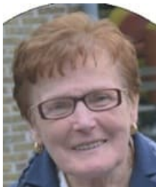
7 541690 foto

Notitie bij Esther: Rouwbericht - Kieslijst