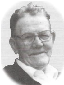
16 83951 foto

Notitie bij Maria: Rouwbrief - Bidprentje - Kieslijst