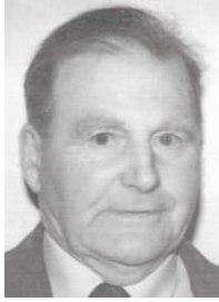
4 101055 foto