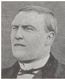
59 25414 foto